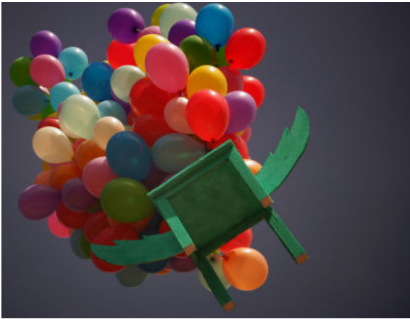
Stuhl in Oberjoch Allgäu Schulakademie