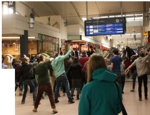
Flashmob beim Flashmob in der Potsdamer Bahnhofspassage der Deutschen Schulakademie